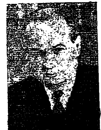
بعثة عراقية إلى فرنسا

كل الفقاوحت سقف واحد رمة ياريتغ تدفن رملة حاسمت الدم المخصدة - رويتر - ذكرت مصادر غربية كبيرة أن استبعاد السوفييت أو عدم استعدادهم للعمل من أجل تسوية في الشرق الأوسط خلال الأسابيع القادمة سيظهر أن كان التوافق بين الشرق والغرب سيضع كضحية لازمة تشيكوسلوفاكيا. وقالت المصادر أن الوضع في أوروبا الشرقية واستمرار النزاع في الشرق الأوسط سيكونان من المواضيع البقية على صفحة ٤٨